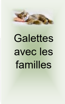
Galettes avec les familles